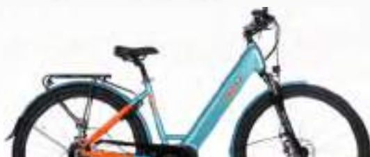
BLEU PAON : Réf.10408 taille S | 10402 taille M