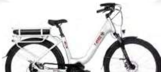
BLANC : Réf.10204

BORA-BORA® FRAMBOISE Référence : 10203 - Taille M (45)