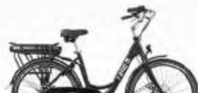
NOIR : Réf.10106

A S P H A L T C O L L E C T I O N | 15 | A F R E E D O M E X P E R I E N C E