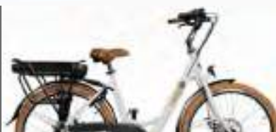
BLANC : Réf.10107