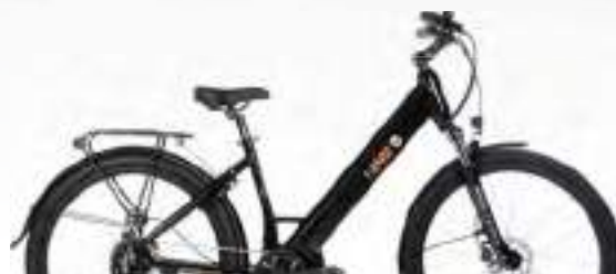
NOIR : Réf.10604 - Taille S (41) | 10605 - Taille M (45)

GOLDEN GATE® CUIVRE Référence : 10607 - Taille S (41) | 10602 - Taille M (45)