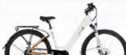
BLANC : Réf.10403 taille S | 10404 taille M

RIVIERA® PRUNE Référence : 10405 - Taille S (41) | 10406 - Taille M (45)