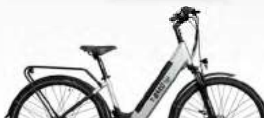
GRIS : Réf.71941