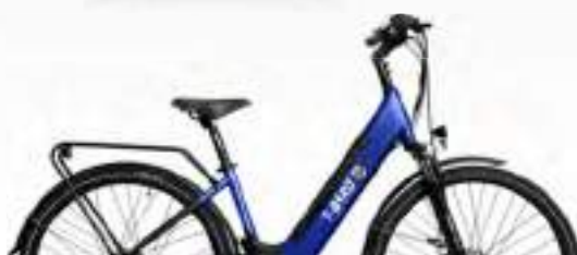
BLEU : Réf.10301