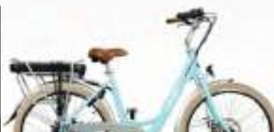
AZUR : Réf.10108