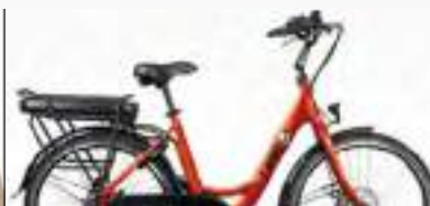
ORANGE : Réf.10109

Moteur moyeu arrière Bafang® 36V/250W/35Nm | Batterie porte-bagage cellules Samsung® ou LG® Li-Ion 36V 12,8Ah (460Wh) | Autonomie jusqu'à 80 km | Cadre aluminium 26" | Fourche rigide aluminium | Dérailleur Shimano® TY300 - 7 vitesses | Freins Tektro® à disque mécaniques | Roues disque 26" | Pneus Kenda® 26x1,95 | Éclairage av/ar sur batterie | Accessoires : Porte-bagage - garde-boues - antivol fer à cheval | Poids 23 kg | Taille medium (45) | Prix public conseillé : 1 549 Euros.