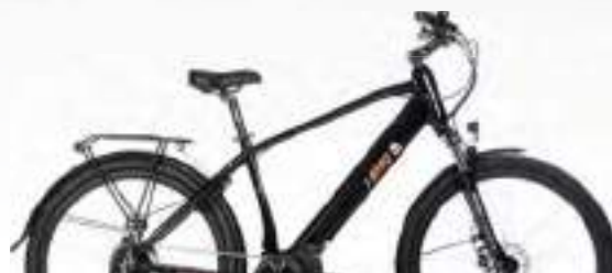
NOIR : Réf.10606

GOLDEN GATE® CUIVRE Référence : 10603 - Taille L (48)